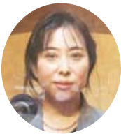
山形銀行 常務取締役